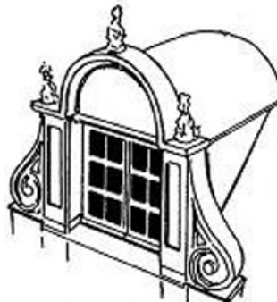
lucarne-fronton ici à ailerons et toit bombé