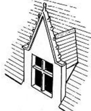
lucarne à gâble