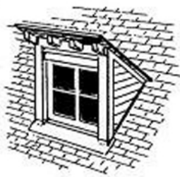
lucarne retroussée, ou demoiselle ; c'est aussi le vrai chien-assis