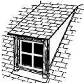
lucarne rampante ou en chien couché