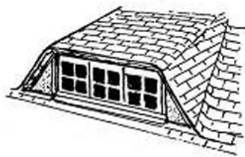
lucarne en trapèze ou rampante à jouées biaisées (couverture en bardeaux d'asphalte)