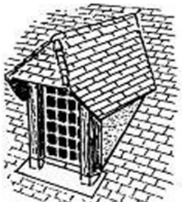
lucarne à demi-croupe, dite normande