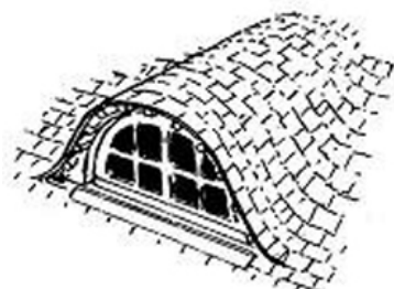
lucarne à jouées galbées (couverture ardoise ou chaume)