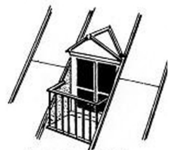
lucarne rentrante ou à jouées rentrantes