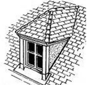
lucarne à croupe, dite capucine ou "à la capucine"