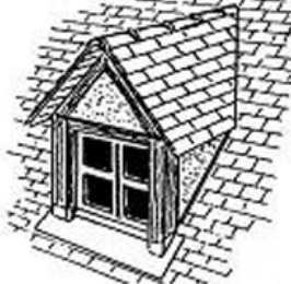
lucarne à deux pans dite jacobine, en bâtière ou à chevalet