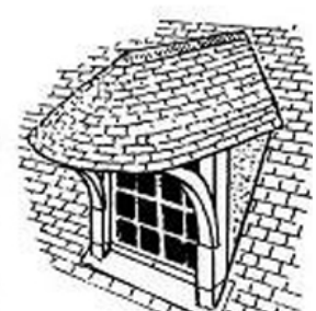
lucarne à guitare (V. sa charpente à ce mot)