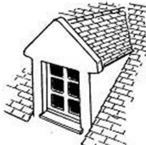
lucarne-pignon, ici à fronton triangulaire