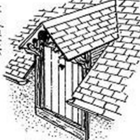
lucarne pendante, dite meunière, ou gerbière